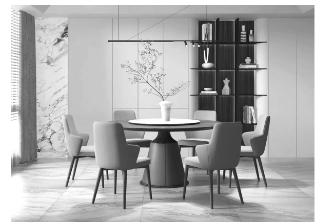
本版由本报记者黄海莲采写

家居的清凉除了“空调、西瓜、WiFi”，空间搭配也能带给人清凉的感觉，希望可以在炎炎夏日里，帮助各位小伙伴的房子来个清凉大变身！