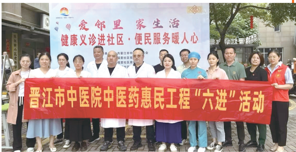
晋江市中医院中医药惠民工程“六进”活动

同时,为提高居民健康素养,养成健康生活方式,医院义诊团队结合居民的生活习惯及身体状况,有针对性地给予健康指导和建议,还为居民科普高血压、糖尿病、冠心病等慢性病的日常调理和预防保健知识,促进居民养成健康的生活方式和饮食习惯。