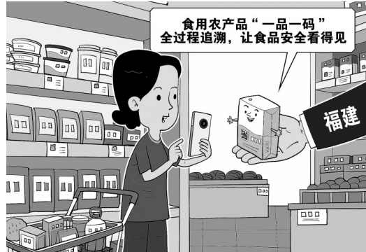
“一品一码”新华社发 朱慧卿 作

新华社福州5月18日电 民以食为天，食以安为先。如何守护“舌尖上的安全”，让老百姓吃得健康、吃得放心？福建给出的答案是：食用农产品“一品一码”全过程追溯，让食品安全看得见。