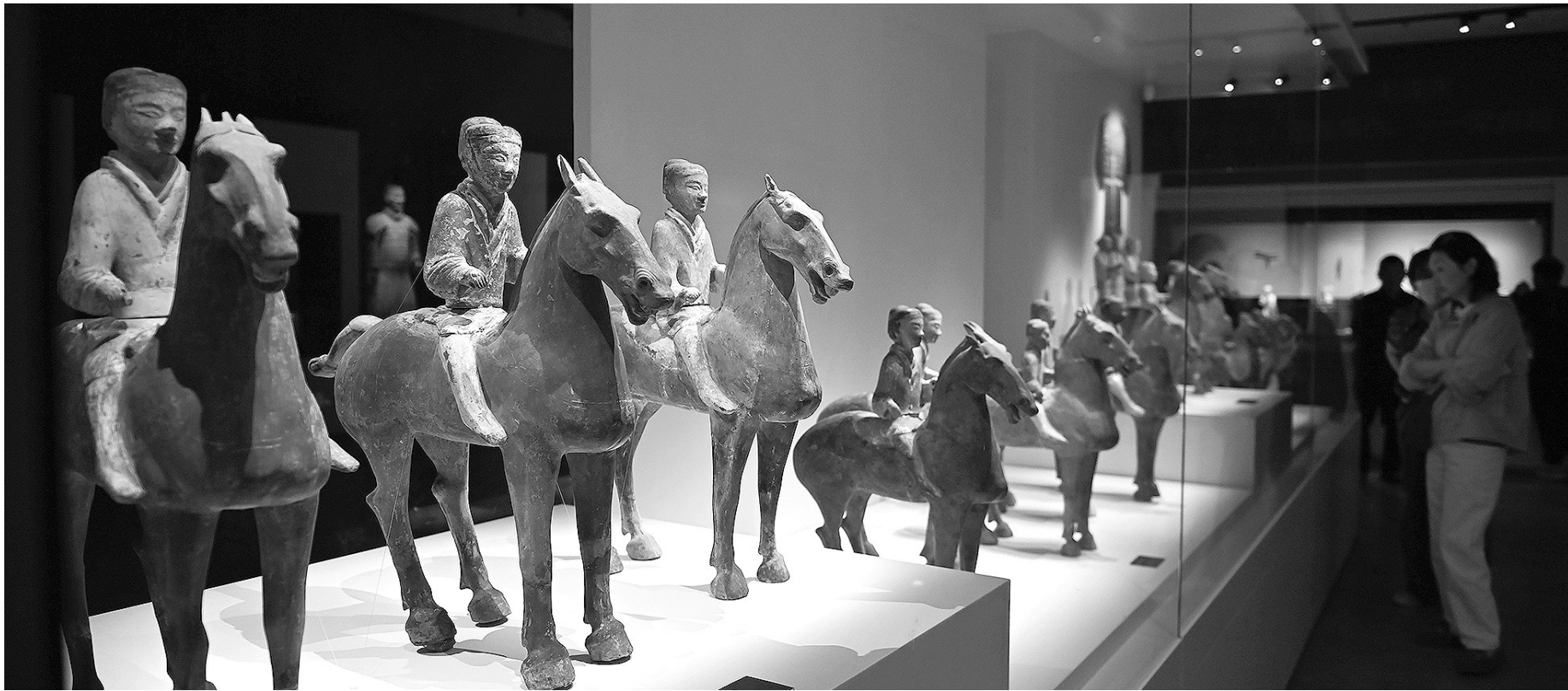
观众在陕西历史博物馆秦汉馆参观。

习近平总书记任在陕西考察时强调，“一个博物院就是一所大学校。要把凝结着中华民族传统文化的文物保护好、管理好，同时加强研究和利用，让人们说话，让文物说话”。文脉悠悠，气象万千。以博物院这所“大学校”为依托，陕西一体推进文物保护、文化繁荣和文明传承。丰厚的文化遗产被不断活化利用，成为人们滋养精神、涵养自信的重要来源。