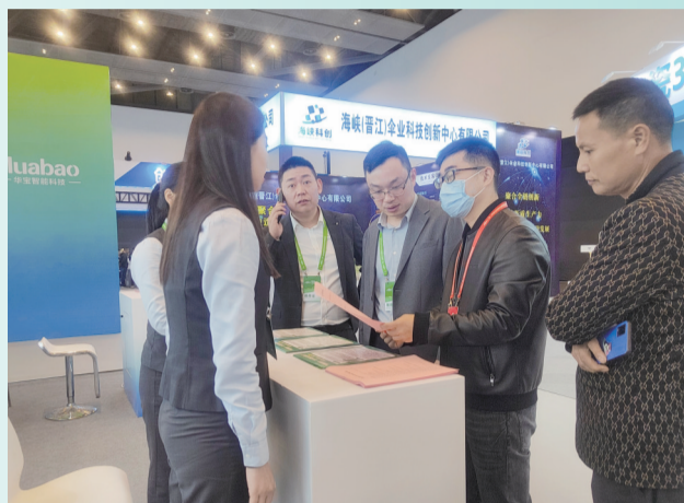
参加第一届晋江科洽会,开展“普惠金融推进月”宣传活动。

扎根当地,服务晋江,授信金井镇鲍鱼养殖户就是农行晋江支行践行普惠金融的一个缩影。今年初以来,农行晋江支行多措并举,多点发力,助实体、保权益、促消费、倡普惠,积极落实“普惠金融推进月”行动部署,普惠之光点亮千企万户。截至2024年3月末,该行普惠小微贷款余额突破70亿元,小微e贷、微捷贷、链捷贷等信贷产品余额屡创新高。