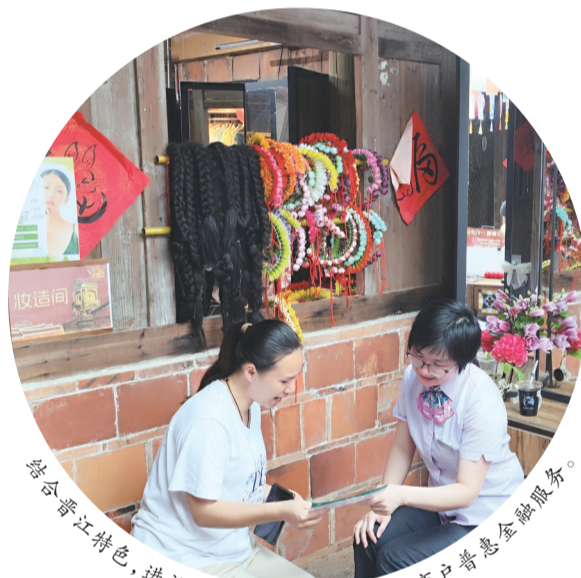
结合晋江特色,进社区进商圈,开展特色化商户普惠金融服务。

同时,该行强化数字化工具应用,深入推进“智慧融”精准服务,优化完善精准识别模型,推动精准服务“量减质增”。充分利用“普惠e站”广泛触达优势,运用好微信立减金、利率券等特色功能,做好宣传推广工作,持续拓宽普惠金融覆盖面。加大移动营销PAD应用,利用PAD微捷贷人工复核、抵押e贷线下调查等应用,推进线上线下融合发展。用好“e企查”“智拓客”、电子名片、“一人一码”等各类数字化工具,通过数字化、智能化手段推进客户分层分类营销和服务。