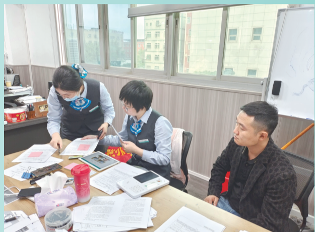
走进中小企业开展普惠金融服务。