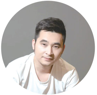
设计单位:华浔品味装饰 设计师:李朗 设计风格:美式奶油风