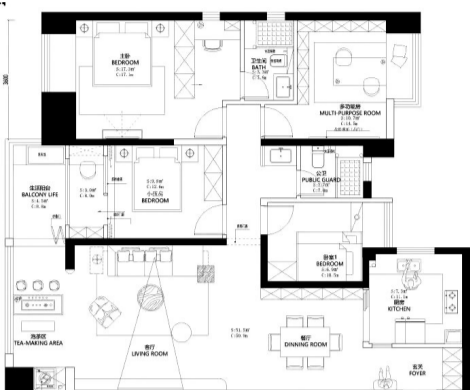
小区:云玺台 建筑面积:145平方米

设计说明:本方案的业主希望家是温馨简洁、布局灵活的,能从中寻求真正的自在与享受。设计师通过前期与业主多次深入沟通,最终将风格定调美式奶油风,获得业主认可。