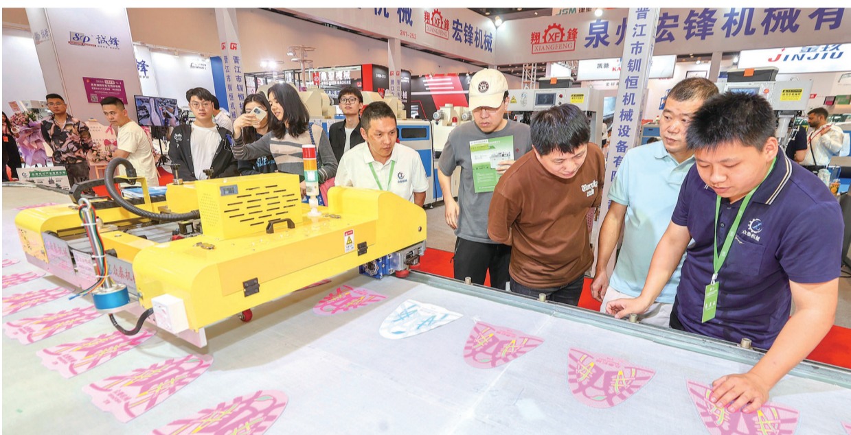
众多客商在鞋机馆众泰机械展位观看展示。 本报记者 董严军 摄