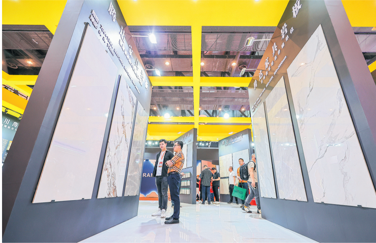
各大展区展品吸引众多客商驻足。(更多报道见5版)