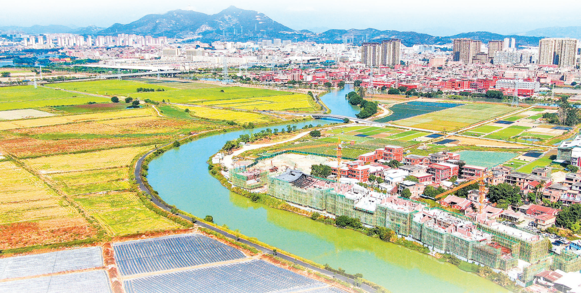
九十九溪田园风光项目