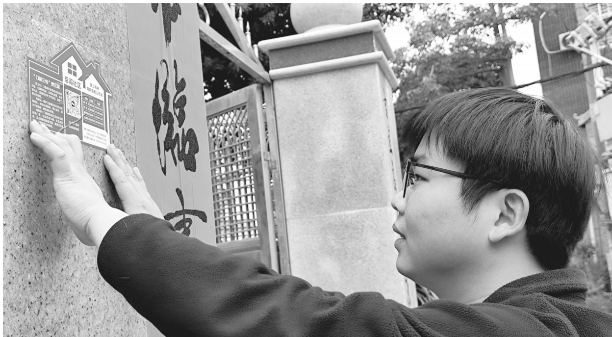
工作人员张贴“门前三包”责任牌。