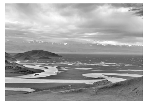
摄影作品:《九曲十八弯》 作者:庄丽雅(女,1959年生)