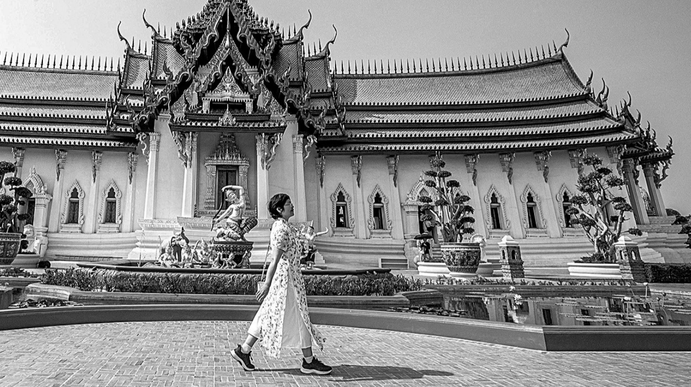
3月1日,中国与泰国互免持普通护照人员签证协定正式生效,中泰迈入“免签时代”。该协定于1月28日在泰国首都曼谷签署。根据协定,中方持公务普通护照、普通护照人员和泰方持普通护照人员,可免签入境对方国家,单次停留不超过30日,每180日累计停留不超过90日。图为3月1日,中国游客在泰国北榄府暹罗古城拍照。