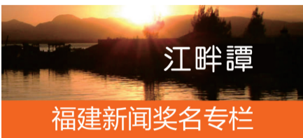
江畔譚 福建新闻奖名专栏