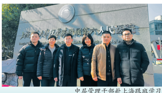
中层管理干部赴上海跟班学习