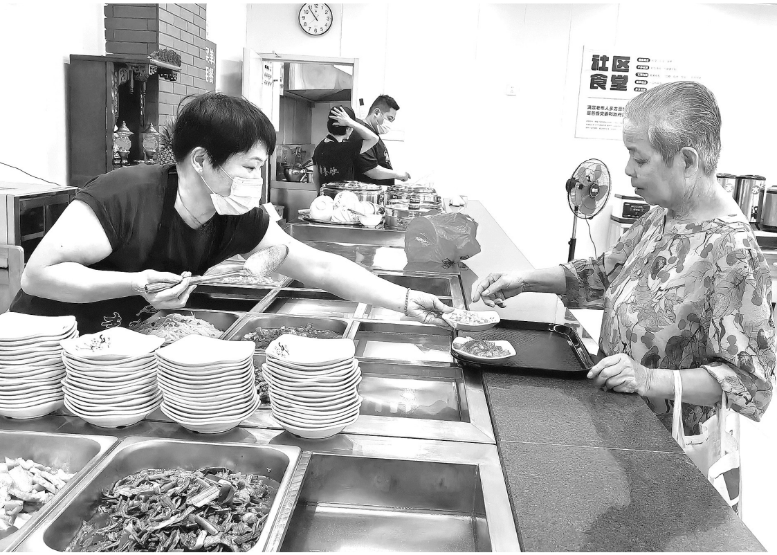
9月28日，梅嶺竹園小區長者食堂正式運營。

園王厝社區、靈源曾林社區、池店鎮橋南社區、安海鎮西門村、英林鎮嘉排村、金井鎮丙洲村、東石鎮圉園村、東石鎮塔頭劉村、青陽象山社區等10個示範性長者食堂項目已完成建設；