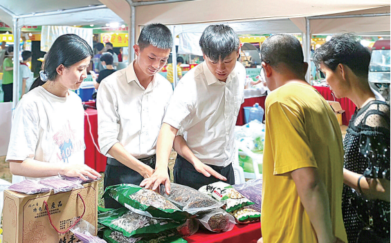
长汀宣成乡展区获得了晋江市民的青睐。

本报讯(记者 王昆火) 山海相连,情更浓。9月11日至15日,全国“村BA”东南赛区比赛在“野球圣地”英林东埔村举行。与此同时,球场外规划了近8000平方米的展位,吸引了200多户商家参展。其中,晋江英林镇对口帮扶长汀宣成乡也组团前来展示山城好货,获得了广大球迷和晋江市民的青睐。 夜幕下的展位好货云集、人头攒动。长汀县梓牧生态家庭农场、大地情怀农业发展有限公司、龙岩市长汀县乡