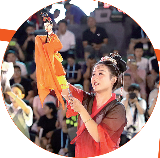
演员身穿汉服表演木偶戏。

观众献上晋江非遗表演。 随后登台的男声小组合唱《潮涌晋江人》和晋江毓英小学带来的二十四节气令鼓,同样精彩纷呈,不仅展现了闽南人热爱生活、奋勇拼搏的精神,也体现了“村BA”积极向上的精神。 “村BA”不止是简简单单的一场篮球比赛,更是独特乡村地域文化的生动诠释。表演结束后,迎来了当晚的重头戏——奖品登场。一盒盒包装精美的奖品被工作人员抬上舞台,吸引了全场观众和球员的目光。在主持人的介绍下,本次东南赛区的奖品也随之揭晓,冠军奖品为海里子福大鲍鱼(黄金鲍),亚军奖品为舒华电动按摩“神器”,季军奖品为舒华筋膜按摩器,殿军奖品为福厂家紫菜、海苔等休闲食品组合装,其他奖项还有一些乡土特产。 “本次奖品中的鲍鱼和紫菜是晋江极具特色的农产品,舒华则是晋江知名体育用品企业。农体结合的方式,与‘村BA’的理念不谋而合,同时也展现了晋江特色。”晋江市农业区划中心副主任林英浚告诉记者,无论是承载着闽南特色的文艺演出,还是极具晋江特色的奖品,都诠释着晋江浓厚的文化底蕴和拼搏向上的精神。