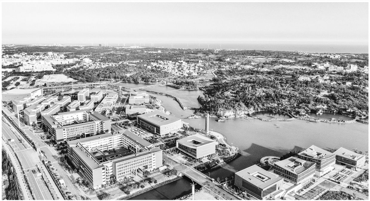
福州大学晋江校区