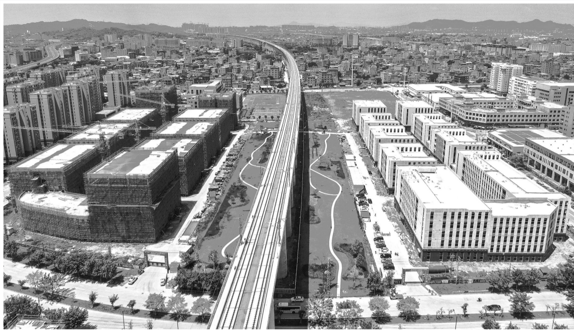
晋江新智造产业园