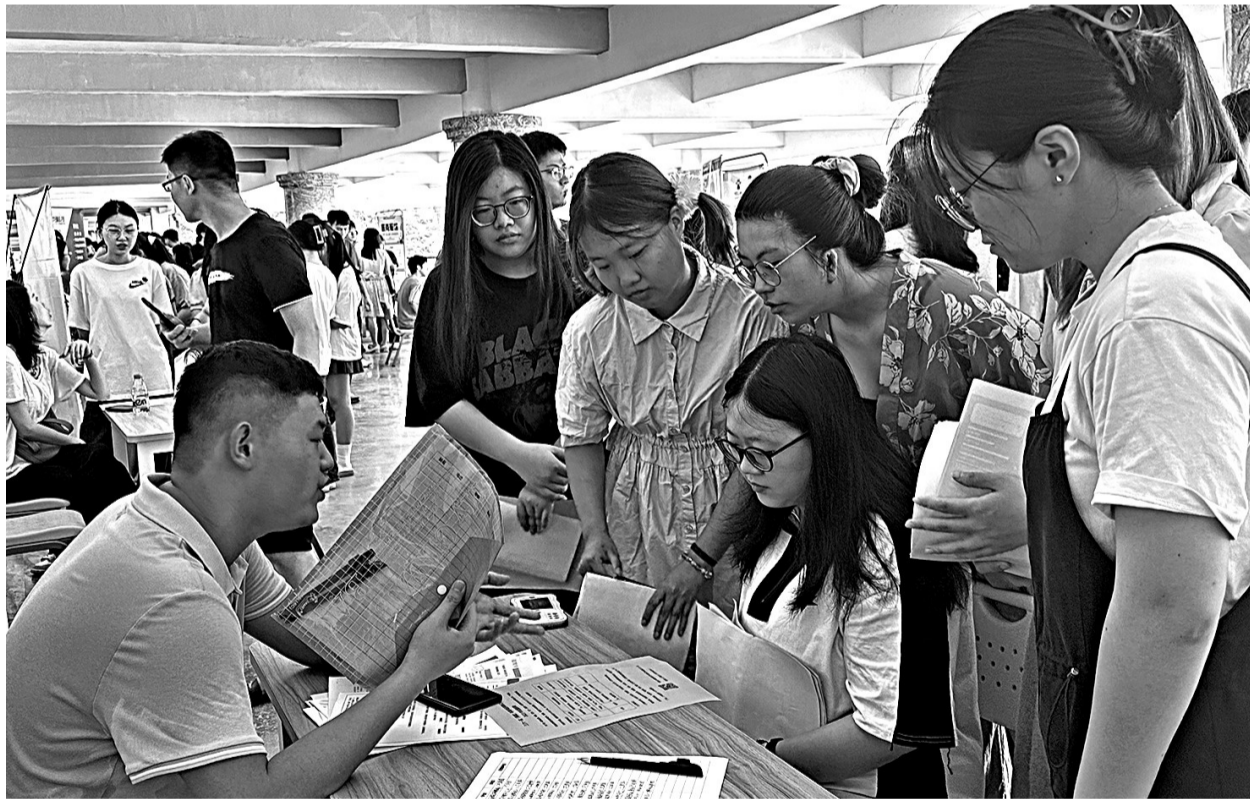
求职者与招聘单位面对面交流。

征收土地总面积574亩。征迁工作启动以来,指挥部各工作组各司其职,各尽其责、协同协作,8个征迁小组坚持一线服务、现场办公,对征迁难点问题进行分析研判,及时协调解决,确保征迁工作有序推进。