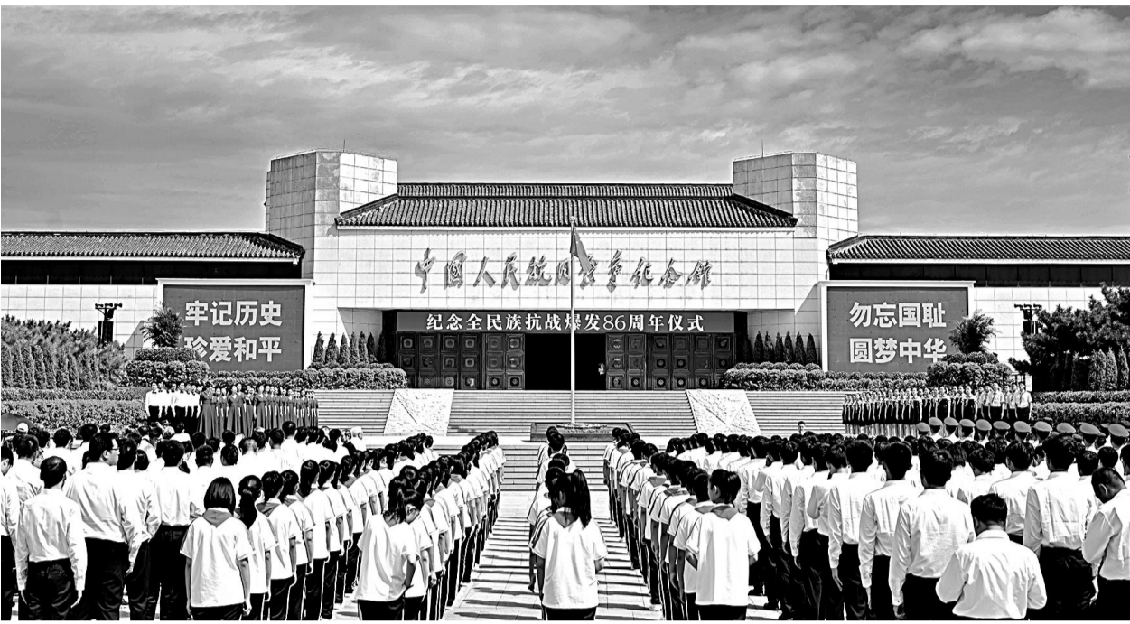
7月7日，各界代表参加纪念全民族抗战爆发86周年仪式。

据新华社 纪念全民族抗战爆发86周年仪式7日上午在中国人民抗日战争纪念馆举行。中共中央政治局委员、北京市委书记尹力主持纪念仪式。卢沟桥畔，气氛庄重。中国人民抗日战争纪念馆巍然矗立。上午10时，纪念仪式在雄壮的国歌声中开始。首都学生代表饱含深情地朗诵了抗战诗文，首都大学生合唱团演唱了《延安颂》《没有共产党就没有新中国》，表达了年轻一代坚定不移跟党走信念，抒发了当代青年矢志为中华民族伟大复兴而不懈奋斗的决心。随后，各界代表缓步登上台阶，依次来到抗战馆序厅，手捧花束，敬献在象征着中华民族团结抗战的大型浮雕《铜墙铁壁》前，并向抗战英烈鞠躬致敬。各界代表还一同参观了“伟大工程——抗战时期中国共产党的建设”专题展览。中央有关部门、中央军委政治工作部和北京市负责同志，在京参加过抗日战争的老战士及抗战将领亲属代表、抗战烈士遗属代表、首都学生、部队官兵、干部群众等各界代表约500人参加。