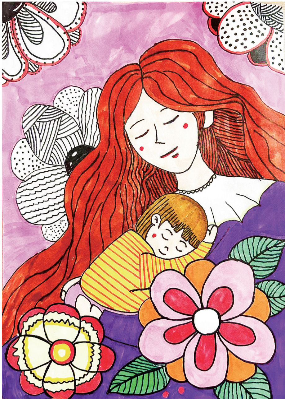
杜忻衡 晋江市第三实验小学滨江校区五年(5)班 指导老师 张春虹

王名源 (晋江金井瀛洲小学三年1班):今年的“六一”我特别期待,因为我有一个心愿,那就是让爸爸妈妈带着我和弟弟去动物园参观。我从没去过动物园,只从书上或电视里看见又大又凶猛的老虎、灵活可爱的小兔子、脖子特别长的长颈鹿……我好期待在动物园里可以看到这些心心念念的动物,那是多么有趣呀!真希望我的愿望可以实现。