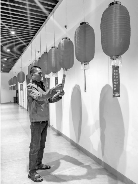
摄影作品:《沉迷其中》 作者:丁良玉女(1951年生)