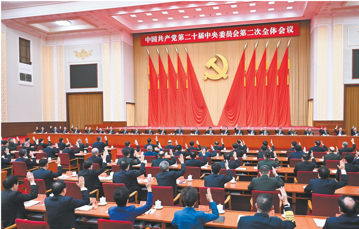
中国共产党第二十届中央委员会第二次全体会议,于2023年2月26日至28日在北京举行。中央政治局主持会议。