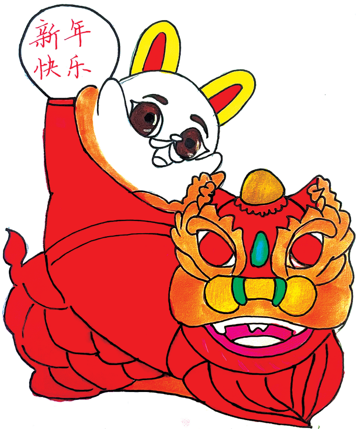
许靖晨(晋江安海龙山小学五年级) 指导老师 蔡雅雯