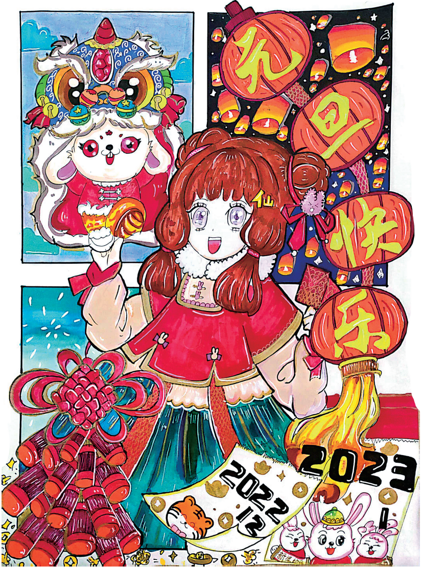
谢婧熹(晋江市第三实验小学海丝校区) 指导老师 杨艺艺