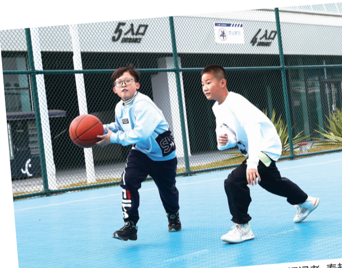
春节期间,市民在第二体育中心篮球场运动。

位于灵源街道的足球训练中心除夜间时段暂停开放外,其他场次正常开放。该中心高规格的球场是许多晋江足球迷的首选,足球爱好者们迎着寒风,在绿茵场上畅快奔跑,享受快乐的运动时光。