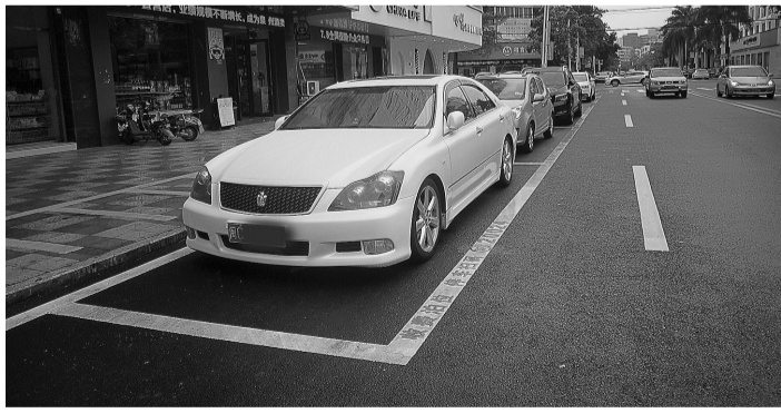
安海成功路上的“智慧停车”项目启动后,车辆停放井然有序,找车位也不再困难。