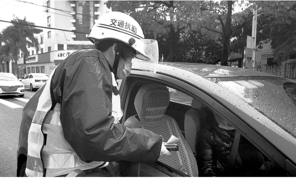
巡检员为不懂“智慧停车”的司机提供帮助。

记者从晋江市停车办获悉,“智慧停车”三期共有1084个停车泊位,包括青阳街道、梅岭街道、罗山街道、池店镇、安海镇等镇街16个路段。泊位全天开放,其中,7:30-21:30为收费时段,其余时间免费。所有泊位停车30分钟内均免费,正式启动收费后,路段不同,收费标准也不同。比如,青阳兴盛路、洪山路、永泰路和梅岭派出所门口四个路段,1小时内收费5元,超过1小时,每30分钟收费2元,每日封顶50元,而青阳文华路和梅岭御龙湾小区门口、凯撒岛小区门口三个路段,2小时内收费5元,超过2小时后,每30分钟收费1元,每日封顶30元。