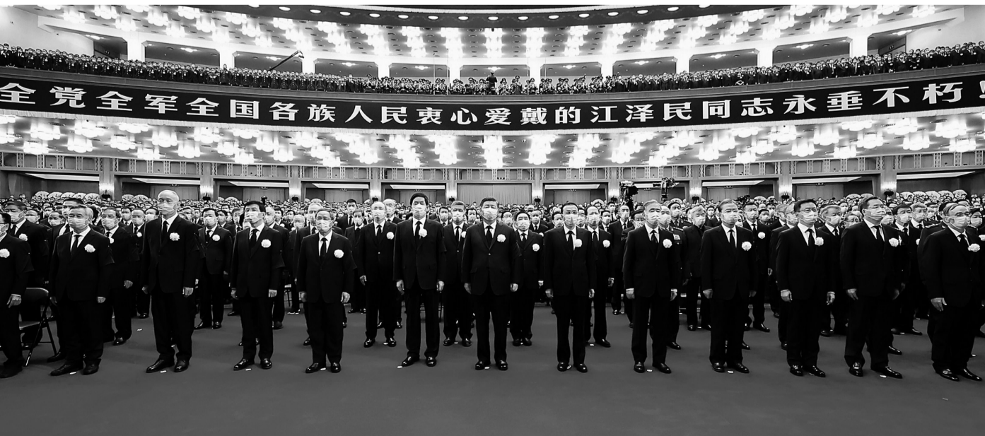
12月6日，中共中央、全国人大常委会、国务院、全国政协、中央军委在北京人民大会堂隆重举行江泽民同志追悼大会。习近平、李克强、栗战书、汪洋、李强、赵乐际、王沪宁、韩正、蔡奇、丁薛祥、李希、王岐山等参加大会。