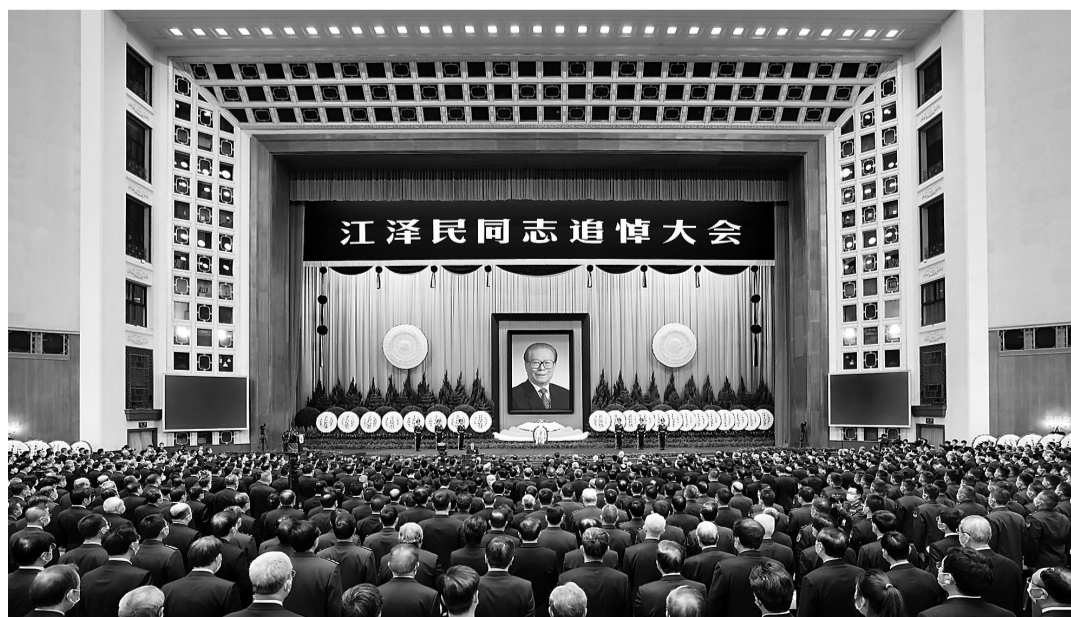
12月6日，中共中央、全国人大常委会、国务院、全国政协、中央军委在北京人民大会堂隆重举行江泽民同志追悼大会。