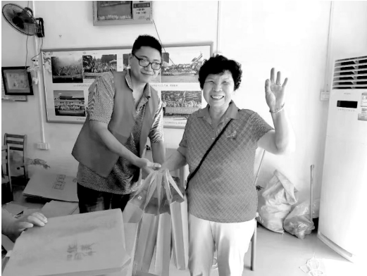
下灶村老人喜领中秋礼包。

本报讯(记者 赖自煌 通讯员 李玲玲)连日来,晋江磁灶镇各村(社区)积极开展“我们的节日·中秋”主题活动,借此弘扬优秀传统文化,引导群众涵养家国情怀,传递公益正能量。