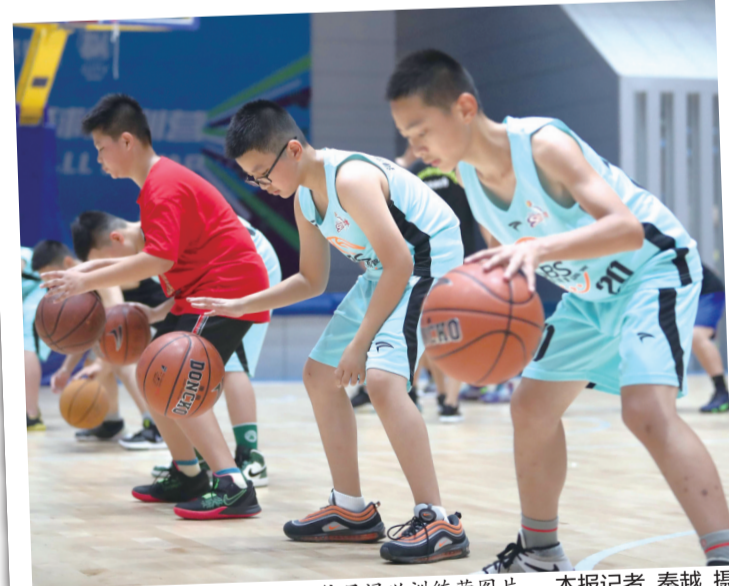
往届浔兴训练营图片。

本报讯(记者 李诗怡)本周末,备受期待的2022年福建浔兴篮球暑期青训营将正式拉开帷幕,敞开怀抱,迎接各位篮球小将的到来,开启暑期篮球之旅。目前,SM站仅剩少量名额。机不可失,时不再来。