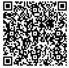
(扫描二维码 加入活动通知微信群)

记者了解到,本次活动还邀请了多位专业摄影师为大伙儿定格笑脸及美好瞬间,活动参与者可扫描右侧二维码,加入活动通知微信群,第一时间掌握活动相关通知,欣赏活动美照。