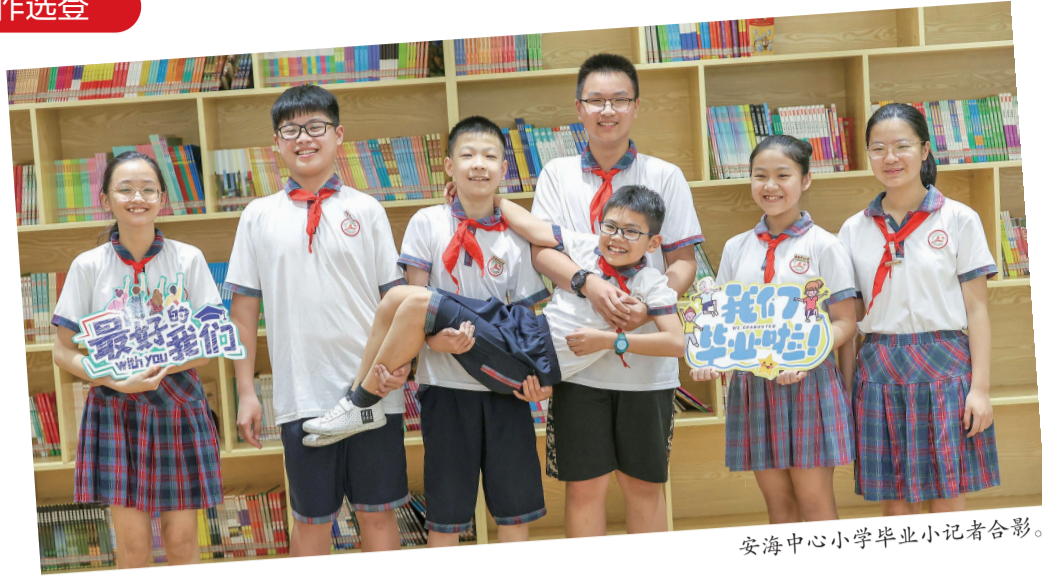
安海中心小学毕业小记者合影。