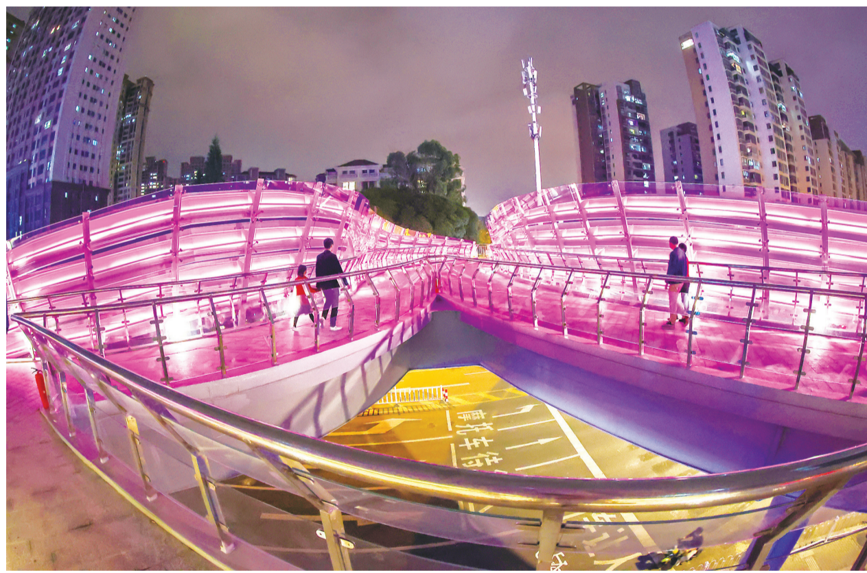
石鼓路-梅园路人行天桥夜景。

而在洋埭村8个二级网格、76个三级网格,驻村工作队也在“使劲”,网格上建起了党支部,网格体系不断完善,基层治理新格局见端倪,发展动能正在集聚。“表里”同步做文章,齐发力,洋埭面貌未来可期。