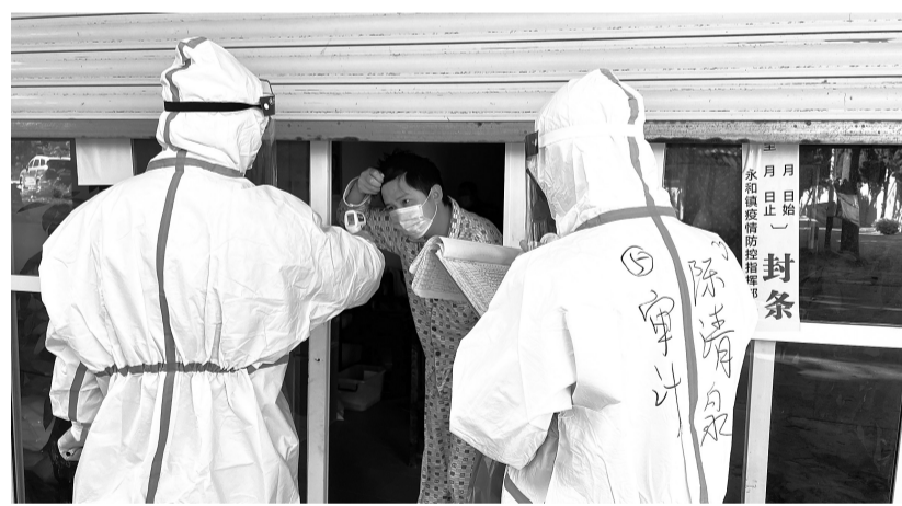
防疫工作者上门为居家隔离者测体温,进行健康监测。

“大家再坚持坚持,曙光很近,胜利不远了。”“感谢政府的关怀,及时送来生活物资,也给了我们信心。”近段时间以来,晋江永和镇割山村的各个防控网格微信群里,不时弹出暖心信息。 自割山疫情发生后,永和镇迅速成立割山村封控区办公室,镇主要领导挂帅,协调各方,通过科学布控、精准施策,做到防控得力、服务暖心,在战“疫”过程中,传递满满的正能量。