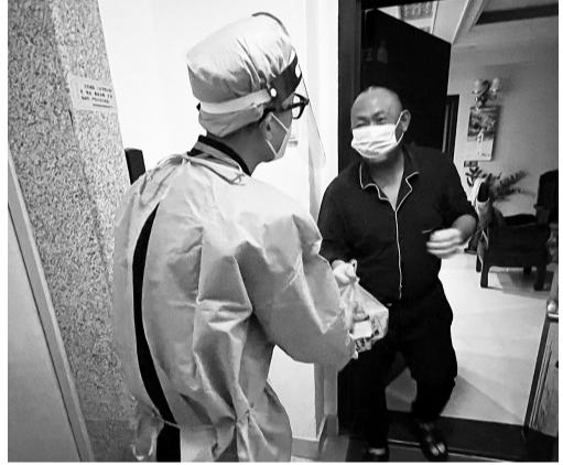
磁灶突击队员为网络群众代购药品并送上门。

磁灶疫情防控突击队相关负责人介绍,支援陈埭镇涵口村后,突击队以村里的网格为单位,将队员分成11个网格小分队,一手抓防疫,一手保民生。一方面协助陈埭镇、村做好网格防控、信息摸排、核酸采样等工作;另一方面,聚焦群众的民生诉求,全力解决群众生活需求,为群众提供送菜、送药、送气等“跑腿”服务,并送去“爱心礼包”,保障群众生活平稳、有序。