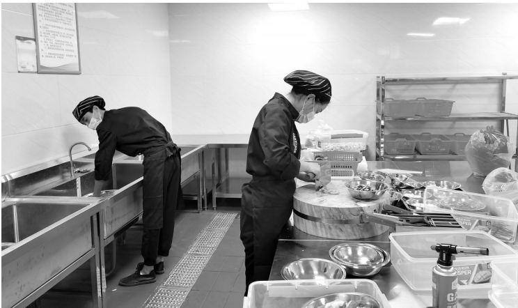
“長者食堂”後廚，員工正在備料。