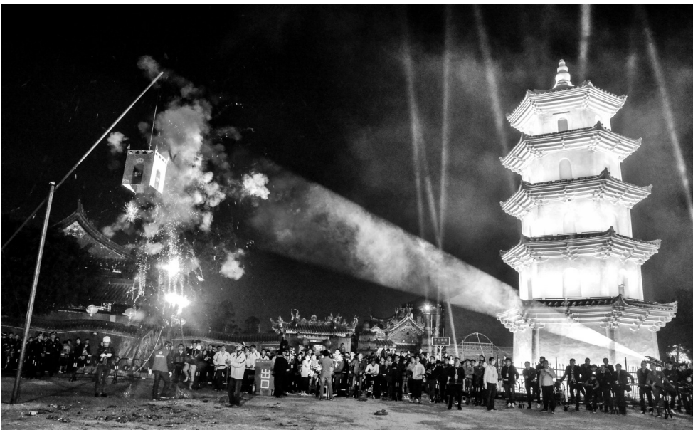
摄影作品:《玫瑰炮城》 作者:苏素华(女,1951年出生)