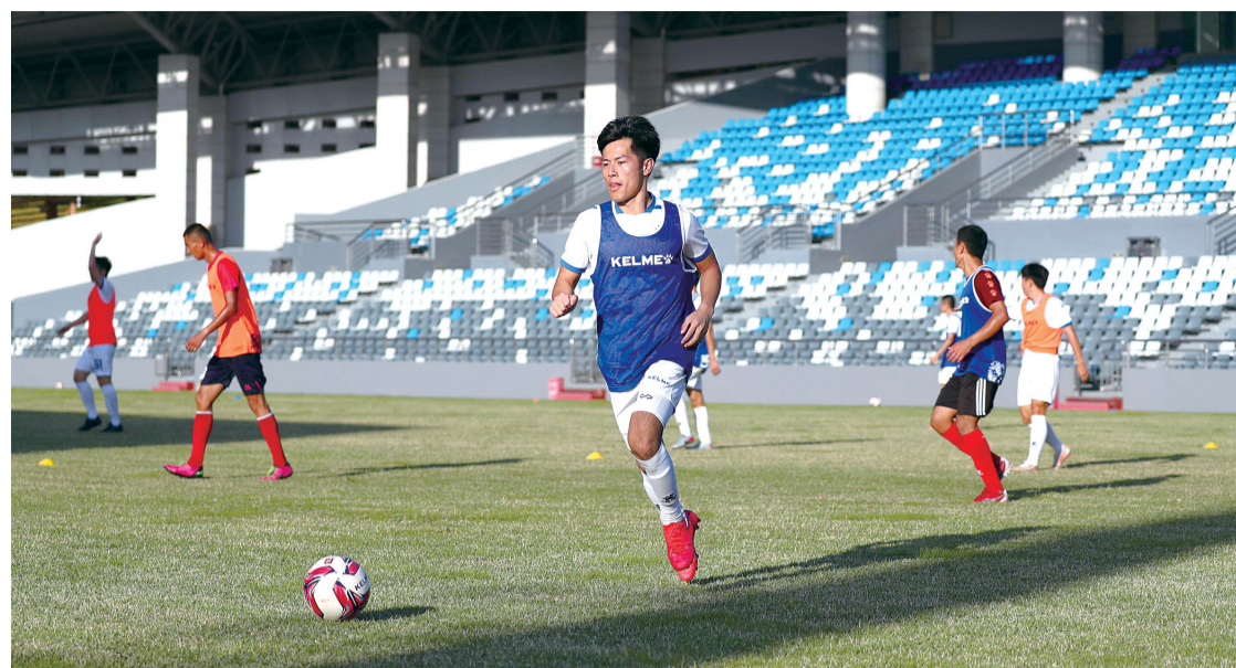
泉州亚新足球队与华侨大学足球队进行热身赛。

明表示,晋江市足球训练中心足球场条件好,绿化养护规范,场地标准贴近中乙联赛,是适合开展足球赛事的最佳场地。 在本赛季中乙联赛的第一阶段比赛中,泉州亚新足球队以5胜2平7负积17分完成本赛季第一阶段全部比赛,排名沪西赛区第五、总排名第十五。由于第一阶段总排名第15位,泉州亚新队未能打进冲甲组,只能留在保级组继续比赛。 在第二阶段保级组的比赛中,泉州亚新足球队被安排在了江苏盐城赛区,与泉州亚新队同组的球队有西安骏狼队、河北卓奥队、绍兴柯桥越甲队、内蒙古草上飞队、湖南湘涛队、延边龙鼎队、昆明郑和船工队。根据规则,保级组的第8名直接降入中乙联赛,第7名将进行附加赛。只要排名赛区前6,泉州亚新队就将完成中乙保级。 据了解,泉州亚新足球俱乐部原名泉州爱德马足球俱乐部,成立于2019年4月4日,由爱德马集团与福建男子足球队合作组建。2020年,球队