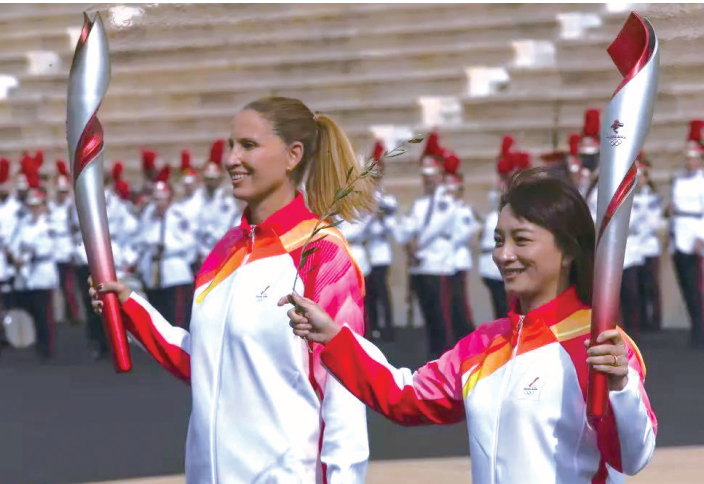
火炬手身着安踏设计的服装。

本报讯（记者 柯国笠）昨日上午，北京2022年冬奥会火种抵达北京，并在奥林匹克塔从火种灯引火点燃北京冬奥会火炬。伴随着北京冬奥会火炬的点燃，距离北京冬奥会开幕仅约百天，晋江品牌也开启营销“跑”进入冬奥时间。