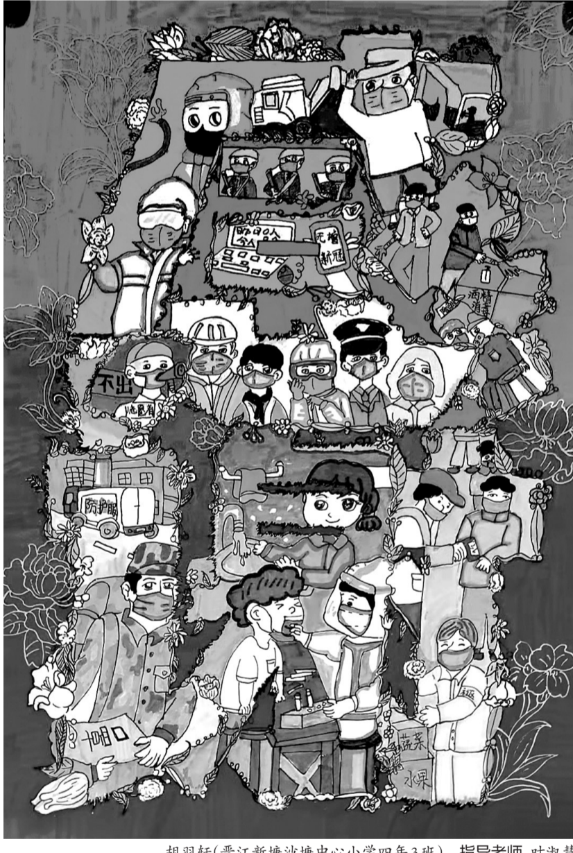
胡羽轩(晋江新塘沙塘中心小学四年3班) 指导老师 叶淑慧