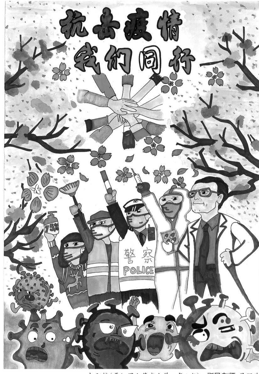
柯阳榕(晋江罗山荣宗小学四年2班) 指导老师 吴珊瑜