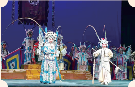
戏剧展演丰富市民生活。