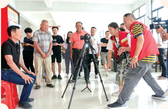
摄影志愿者服务队在永和镇为村民拍照。