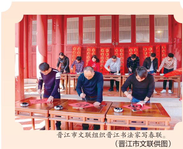
晋江市文联组织晋江书法家写春联。