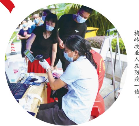
梅岭物业人在防疫一线。

昨日是中秋佳节,晋江梅岭街道各社区、小区防疫一线,街道各工作点、社区干部和各小区物业、志愿者等仍坚守防疫岗位,为群众生命安全保驾护航。连日来,在晋江市疫情防控指挥部的部署下,梅岭街道全力推进重点人群大数据摸排、跟踪管理及核酸检测等各项防疫工作,街道上下齐心协力投入抗疫一线。即日起,《梅岭印迹》推出战“疫”系列专题,本期关注在梅岭战“疫”一线默默付出的那些人。