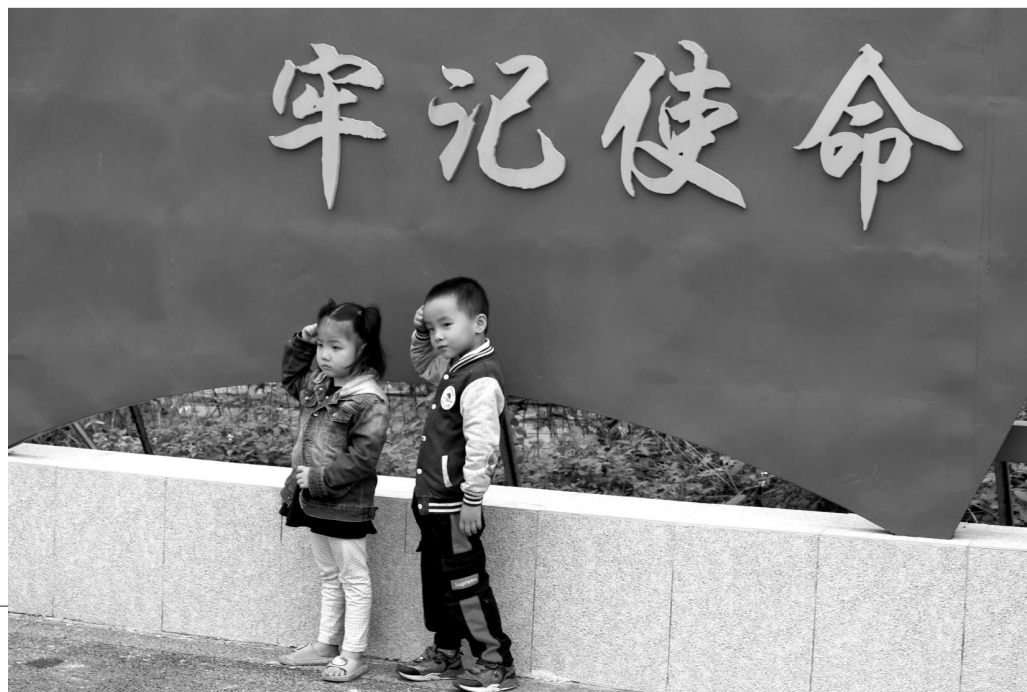
摄影作品:《接班人》 作者:蔡尤成(1951年11月出生)

书法、绘画、摄影、诗词、剪纸……如果你喜欢这些,擅长这些,那么,这里便是你展示的舞台。“才艺秀场”作为展示老年朋友才艺作品的平台,长期面向全市老年朋友征集优秀作品。