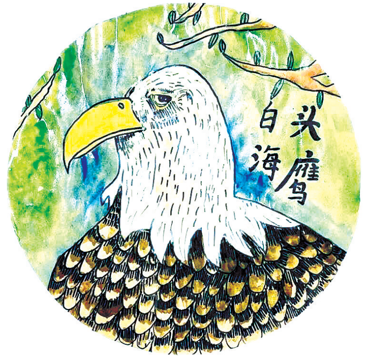
苏柯翔(晋江梅岭心养小学) 指导老师 陈逸云