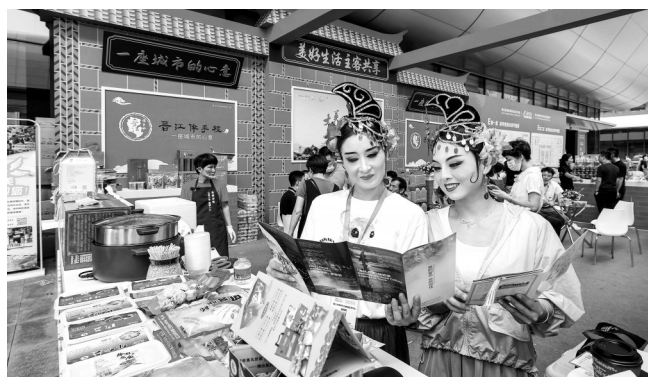
食交會晉江伴手禮展位上,古裝美女助陣。

關注晉江、推介晉江、支持晉江,多到晉江參觀考察、投資興業、共謀發展。晉江市將用心營造一流營商環境,全力當好“店小二”“服務員”,竭誠提供細致周到、優質高效的服務,與大家攜手共進、共贏未來。 晉江市委副書記、代市長王明元主持開館儀式。開館儀式後,與會領導及嘉賓巡視主會場,以及豪新食品市場分會場。 據悉,本屆食交會主會場開設A、B、C、D、E、F六大主題館,比上屆增設一個展館;參展面積達6萬平方米,比上屆增加1萬平方米。其