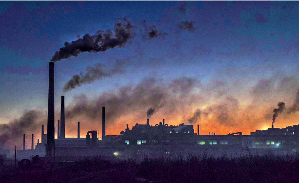
旧日的东海垵乌烟滚滚。

土壤防治工作,晋江出台相关方案,明确受污染耕地安全利用工作涉及地块,指导污染地块土地使用人开展风险管控和治理修复,同时,开始自然保护区专项整治,全面提升农村环境。