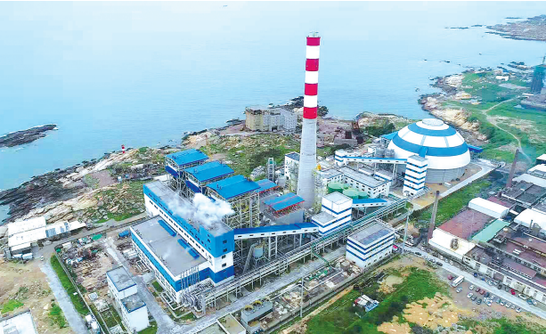
如今的东海垵天蓝水清。