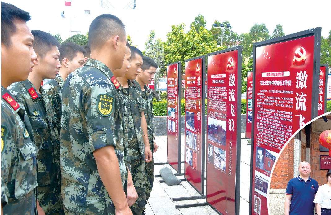
6月30日，晋江市委党史方志室“百年晋江党史纪事”图文展进军营。

2021年是中国共产党的百年华诞，为推进党史学习教育走心、走深、走实，中共晋江市委党史和地方志研究室（以下简称“晋江市委党史方志室”）创新开展“红色文化+”系列活动，着重以“六个一”（即一书、一刊、一讲、一课、一展、一栏）等为载体，以开展红色文化“六进”（即进机关、进校园、进企业、进社区、进农村、进军营）为渠道，线上线下全覆盖，讲好红色故事，让更多人了解晋江红色文化，传承红色基因，在党史中汲取奋进的力量，激发干事创业的热情，充分发挥党史方志部门的宣传教育职能，献礼中国共产党成立100周年。