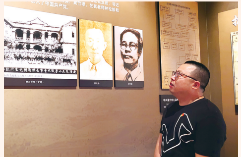
5月27日，晋江市委党史方志室党史编研科负责人在安海许集美革命事迹陈列室开展题为《晋江革命史》的“一堂好课”现场教学。