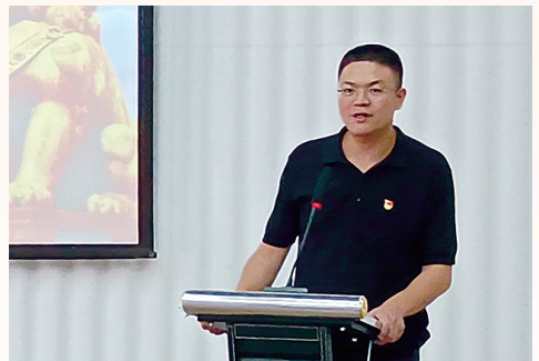
6月11日，晋江市委党史方志室年鉴志书科负责人为晋江市供销社合作社联合社党支部、晋江市三创园公司党支部、三创园入驻企业党员开展题为《晋江革命史》的专题讲座。