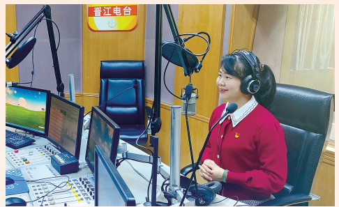
2月23日，晋江市委党史方志室综合科负责人到晋江广播电台参加纪念建党100周年特别节目——《晋江红色故事开讲》。