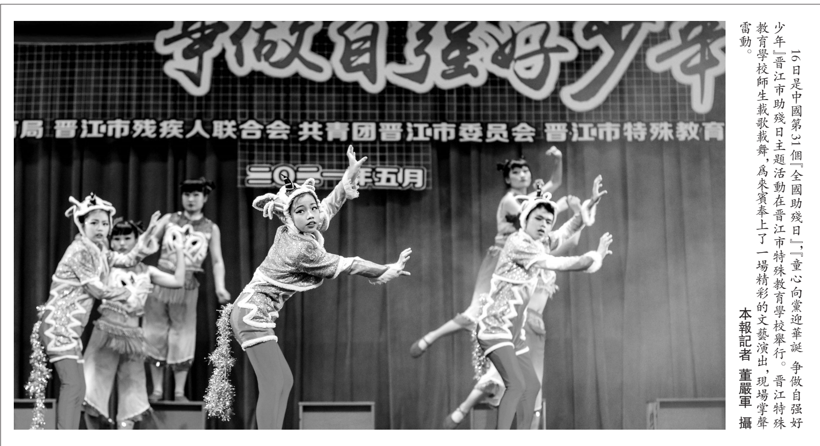
『今日是中國第二個『全國助殘日』，童心向黨迎華誕，爭做自強好少年』晉江市助殘日主題活動在晉江市特殊教育學校舉行。晉江特殊教育學校師生載歌載舞，為來賓奉上了一場精彩的文藝演出，現場掌聲雷動。