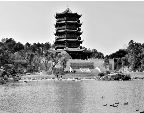
『打卡點』。八仙閣、八仙湖成為遊客必去的

前不久的五一假期第一天，八仙山公園榮登市民游玩休閒的“熱門榜”。公園裏，野餐、散步、跑步、游玩的人比比皆是。據不完全统计，五一當天，八仙山公園裏的游客有上萬人。