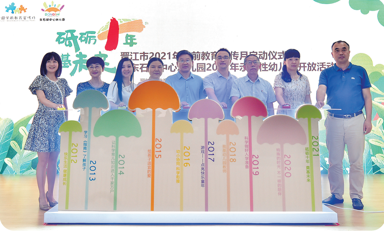
晋江市2021年学前教育宣传月启动仪式,在东石举行。

砥砺前行十年,奠基未来。在第10个全国学前教育宣传月(5月20日至6月20日)到来之际,记者对东石镇学前教育工作进行探访,看东石镇如何围绕“普惠公益”目标,建设公办园、规范民办园、扶持普惠园、创建示范园,推进学前教育实现跨越发展,打造农村学前教育“晋江样本”。