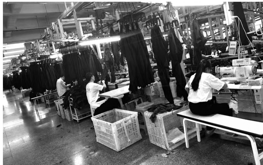
晋江大森制衣有限公司生产车间