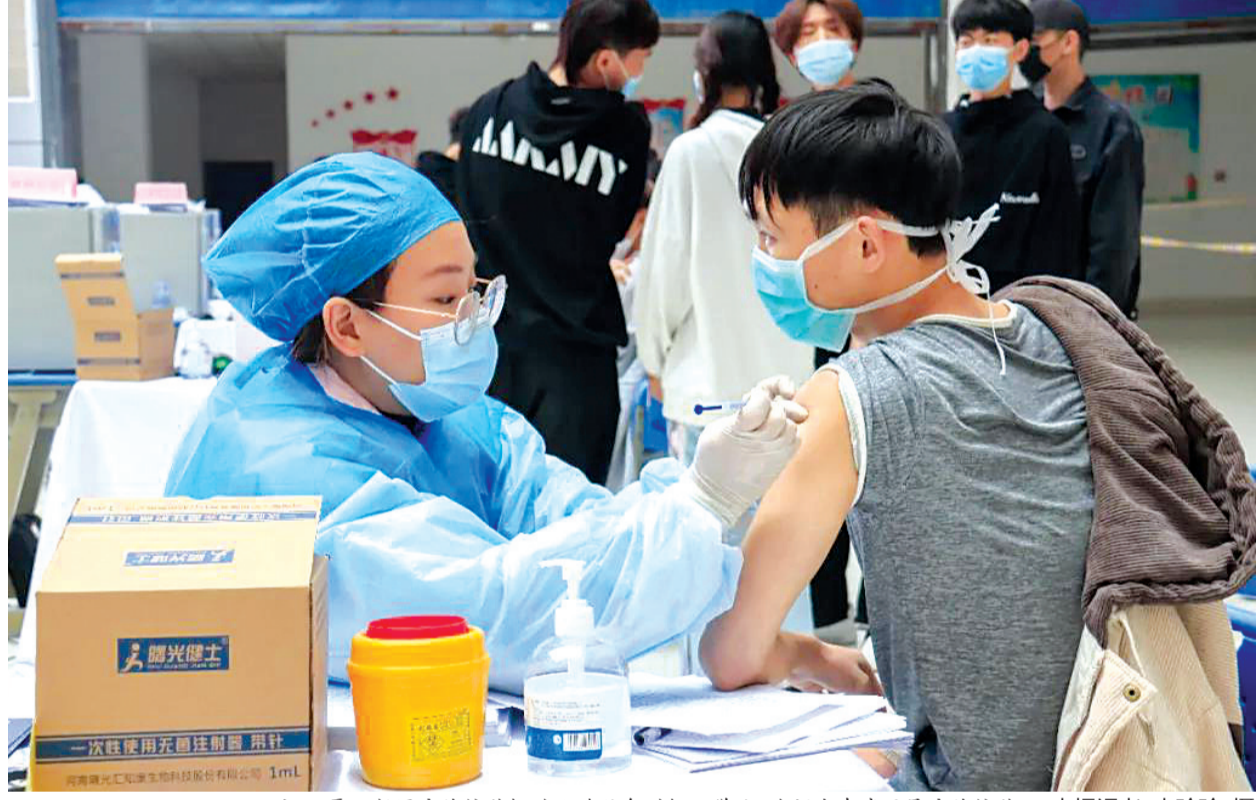
近日,晋江新冠疫苗接种机动队进驻泉州轻工学院,为师生有序开展疫苗接种。

接种疫苗可以提高人体免疫力,连片形成人群免疫屏障,是防控新冠疫情最有效的手段。张文贤要求,新冠疫苗接种事关群众健康安全,各级各部门要提高政治站位,坚决扛起责任,优化工作细节,提升疫苗接种能力,全力做好疫苗接种各项保障工作;要强化协同,快速联动,抓紧完善接种点建设、流程设置、人员配置、物资保障各环节,确保疫苗接种安全有序;要加强宣传组织动员,多渠道做好疫苗接种科普宣传,提升群众接种意愿,确保应种尽种。