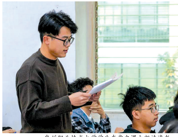
泉州职业技术大学学生在党史课上朗读遗书。

本报记者_蔡红亮 通讯员_洪春锦 郭建武 文图 本报讯 1929年3月24日,烈士赵云霄在狱中给刚满月的女儿留下了一封感人至深的遗书。日前,在泉州职业技术大学一堂党史课上,这封遗书“复活”了。