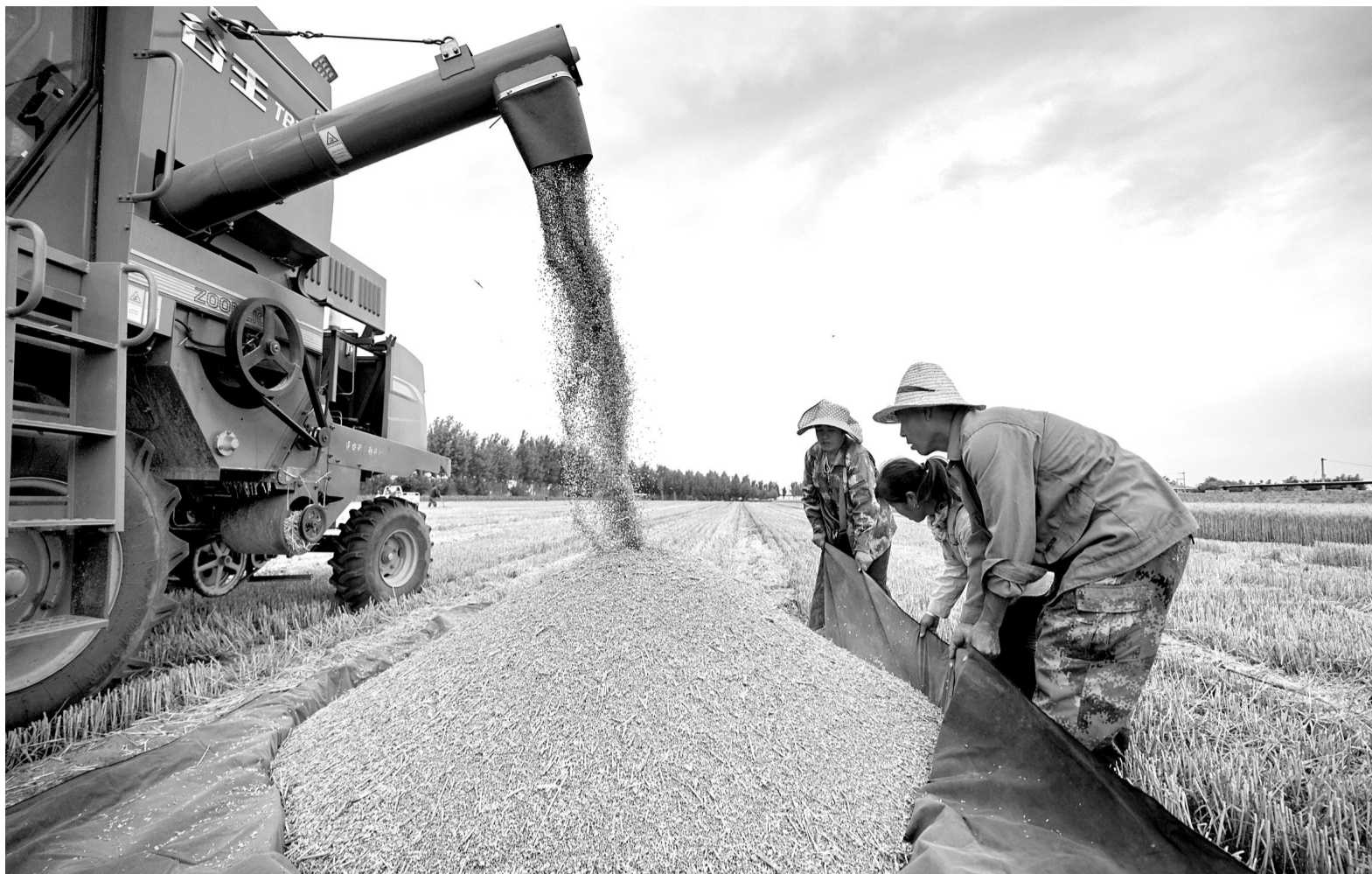
河北省滦州市滦城街道邹家洼村村民在收获小麦。

同时，健全防止返贫动态监测和帮扶机制，守住防止规模性返贫底线，持续加大就业和产业扶持力度；加强农村低收入人口常态化帮扶，实行分层分类帮扶；持续做好有组织劳务输出工作，推广以工代赈，重点建设一批区域性和跨区域重大基础设施工程。并在西部地区脱贫县中确定一批国家乡村振兴重点帮扶县集中支持，坚持和完善东西部协作和对口支援、社会力量参与帮扶等机制。