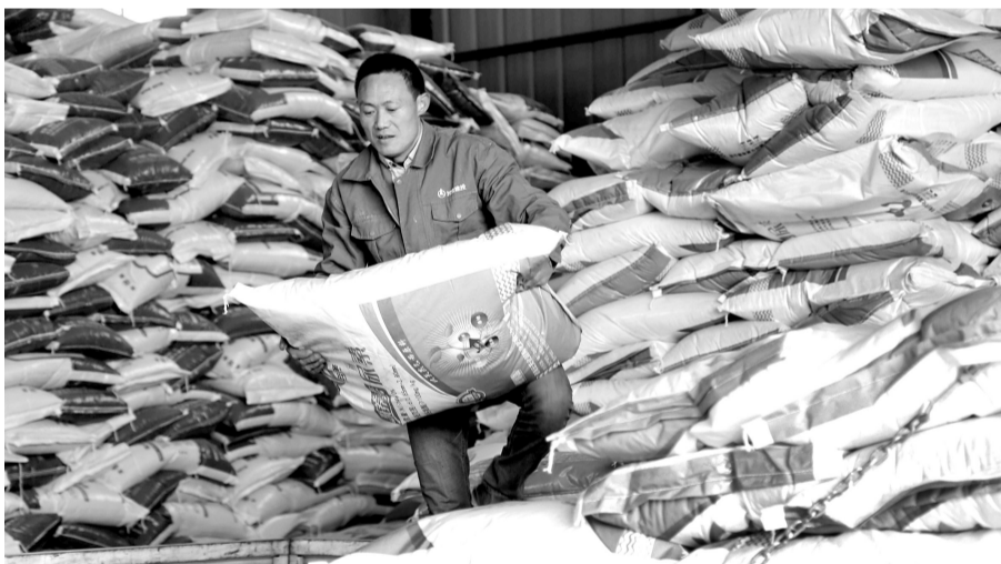
甘肃省定西市安定区一农资配送中心，工人搬运农资装车。春耕临近，各地积极准备种子、化肥等物资，确保春耕生产顺利开展。

专家分析说，除了耕地、水等条件有限外，我国长期以来在水稻、小麦等口粮方面的科研和人力投入多，大豆和玉米方面投入资源相对有限，生物育种等技术应用不充分。